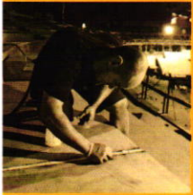
Sealing & Bonding